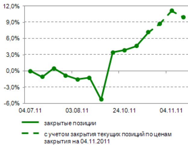
Доходность по консервативной стратегии