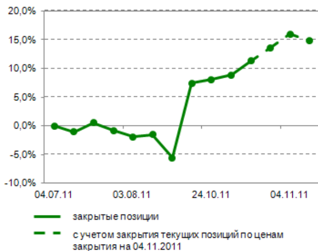
Доходность по агрессивной стратегии