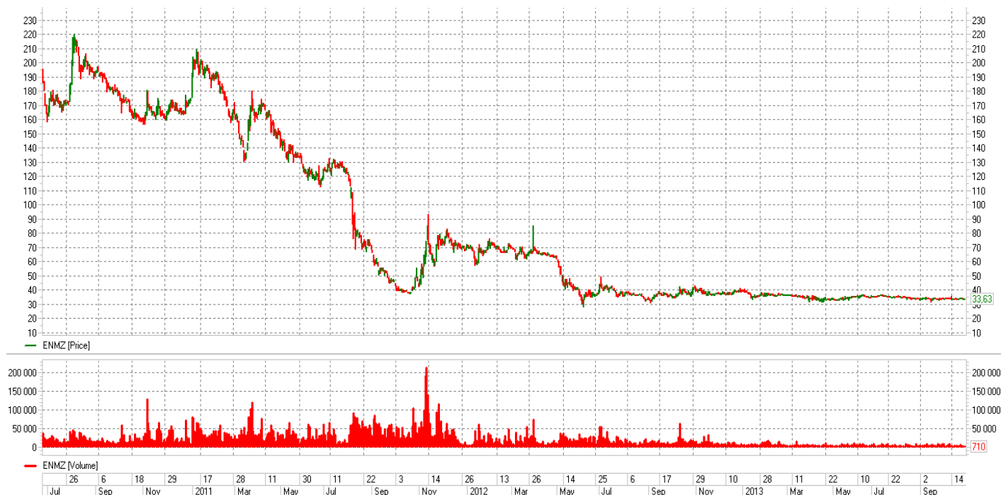
График акции Енакиевского металлургического завода [ENMZ] уже 2 года напоминает горизонтальную линию, поэтому мы не ожидаем в среднесрочной перспективе каких-либо изменений.